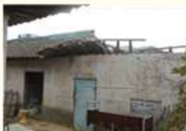
• 창고 지붕 파손