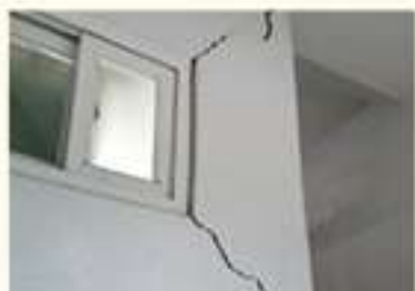
• 주택 균열