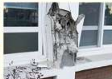
• 흥해초등학교 건물 기둥 파손