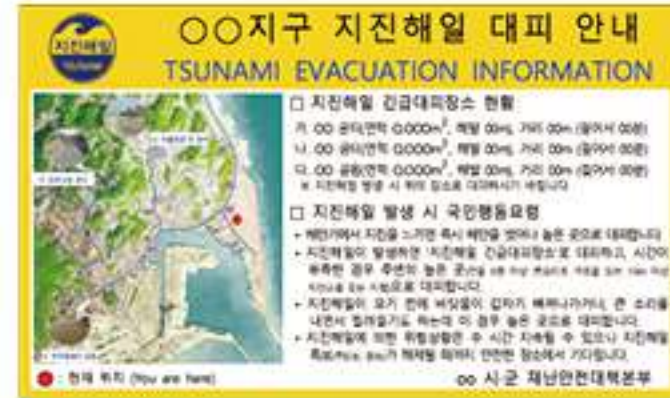
〈지진해일 대피 안내표지판〉

➢ 내가 있는 지역이 지진해일의 위험이 있는 지역인지 미리 확인해 둡니다.