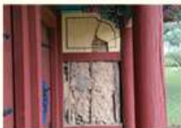
• 신문왕릉 건물 벽체 파손