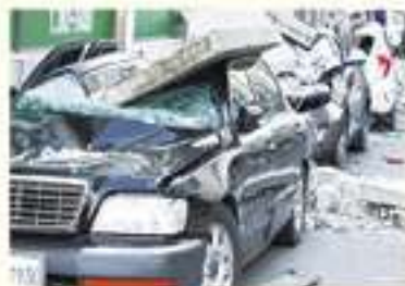
• 조계조 난간 파손으로 인한 차량파손