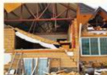
• 장량동 주택 조적벽체 붕괴