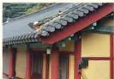
• 불국사 지붕 기와 파손