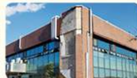
건물 외벽 탈락