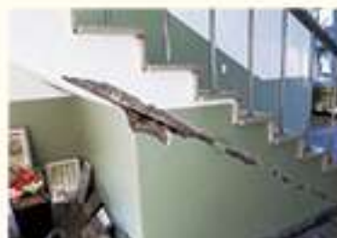
• 포항흥해공고 계단 균열