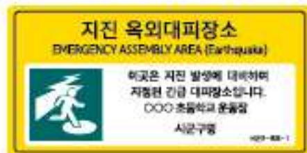
〈지진 옥외대피장소 표지판〉

지방자치단체에서는 지진 및 지진해일 발생 시 주민들이 일시적으로 안전하게 대피할 수 있도록 "지진 옥외대피장소", "지진해일 긴급대피장소"를 지정 및 관리하고 있습니다. 대피장소 정보는 국민재난안전포털(www.safekorea.go.kr), 공공데이터포털(www.data.go.kr) 및 '안전디딤돌 앱'에서 확인할 수 있습니다.