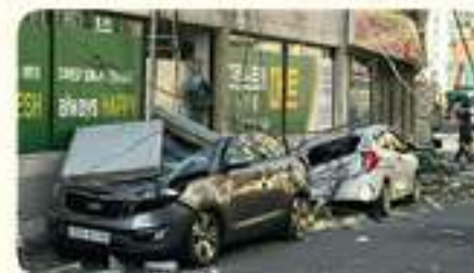
낙하물 차량 파손