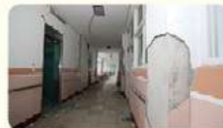
건물 내부 벽체 파손