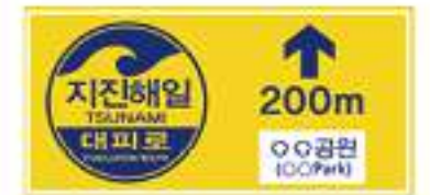
〈지진해일 대피로 표지판〉

➢ 해안에서 지진을 느끼거나 지진해일 특보가 발령되면 빨리 해안이나 하천에서 벗어나, 지진해일 긴급대피장소나 높은 곳으로 대피합니다. 피할 시간이 없다면 주변에 있는 철근콘크리트로 된 튼튼한 건물의 3층 이상인 곳 또는 해발고도 10m이상인 곳(언덕, 야산 등)으로 대피합니다.