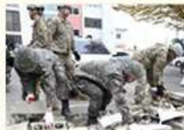
• 포항시 흥해읍 응급복구