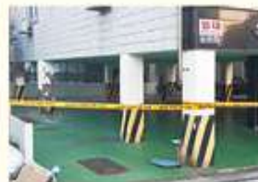
• 장량동 오서빌 밀로티 파손