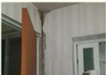
• 주택 균열