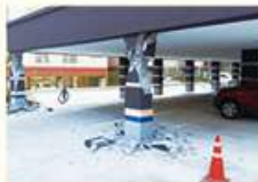
• 장량동 크리스탈 밀로티 기둥 파손