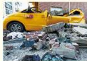
• 조계도 외벽 파손으로 인한 차량파손