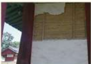
• 경주 향교 벽체 파손