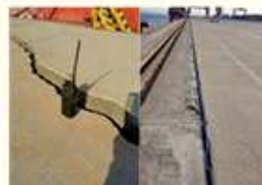
• 영일만항 부두 포장용기 및 균열