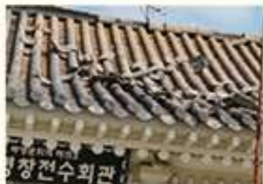
• 무행문화재 전수관 지붕 기와 파손