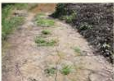
• 사곡지 저수지 둑 균열