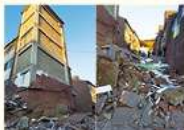
• 환어동 대동빌라 외벽 치장벽돌 탈락