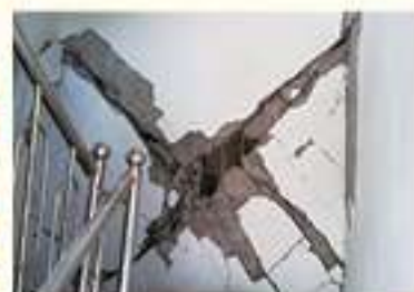
• 장량동 기예공 주택 내벽 파손