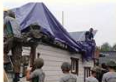
• 경주시 보덕동 응급복구