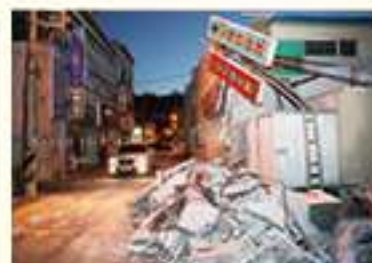
• 흥해읍 상가 외벽 난간 붕괴