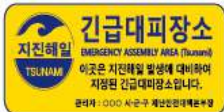
〈지진해일 긴급대피장소 표지판〉