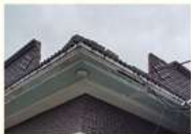
• 주택 지붕 난간 파손