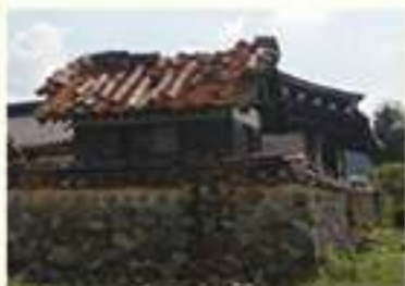
• 사마소 지붕 기와 파손