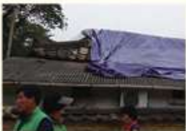
• 경주시 월성동 응급복구