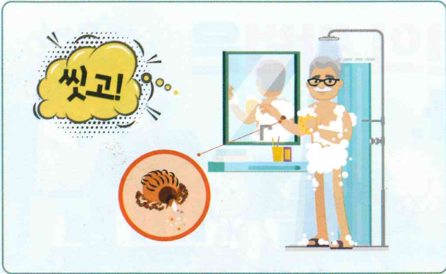
전신 샤워 및 진드기 찾기