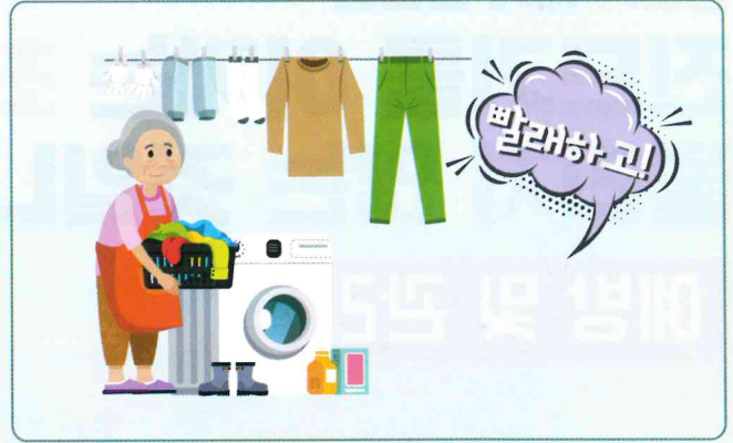
작업복 분리 세탁하기